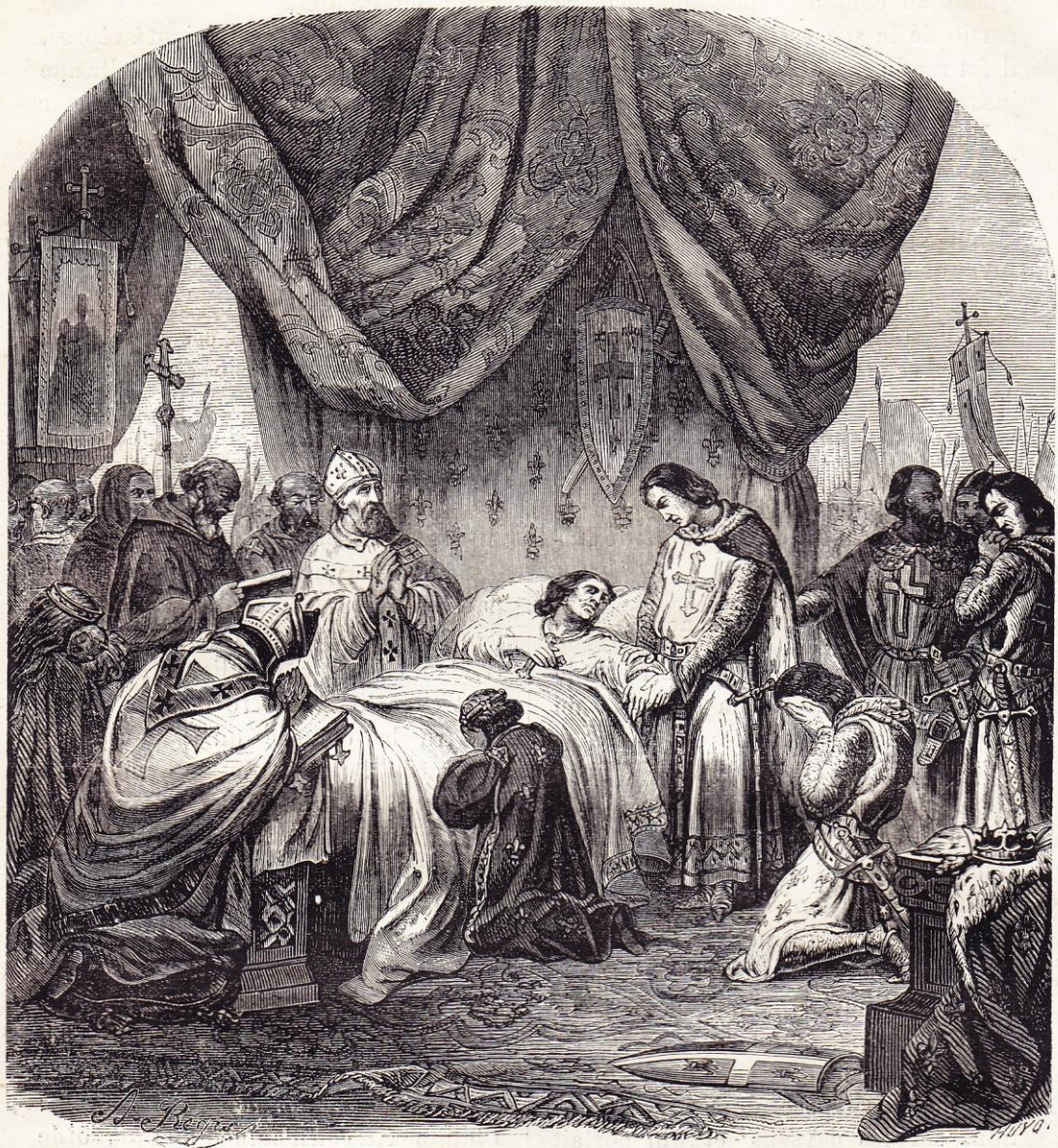
Mort de saint Louis devant Tunis.

litaine et qu'il fit prisonnier. Le vieux roi mourut d'humiliation et de douleur.