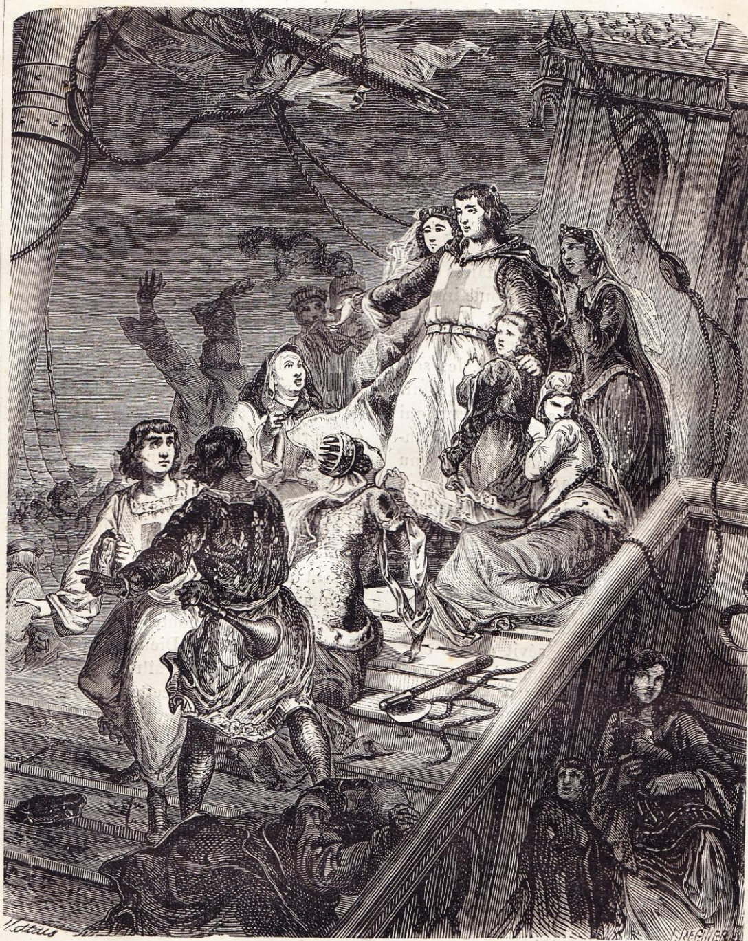
La galère de saint Louis touche sur un rocher (1254).

avec les débris de son armée, sur des vaisseaux génois : une partie, sous les ordres de ses deux frères, fit voile pour